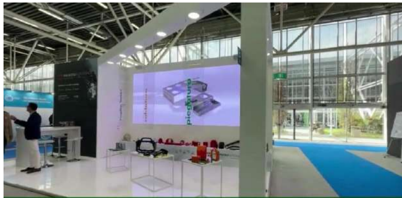
Federunacoma, Malavolti: "Puntare su nuovi mercati"

o S.p.A. -0,91% 7,59 TREVI - Finanziaria Industriale S.p.A. -1,53% 0,3865 Valsoia S.p.A. -1,04% 9,50 Hera S.p.