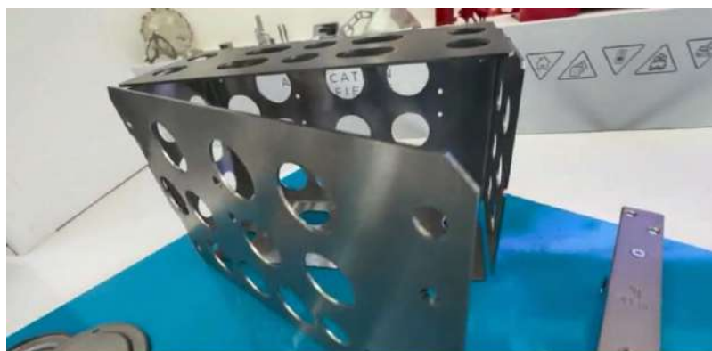
Maserati: nuovo concept store a Venaria Reale

Beghelli S.p.A. 0,00% 0,2720 Igd -1,23% 2,8200 Prismi S.p.A. +1,00% 0,1010 Ferrari N.V. +1,26% 249,50