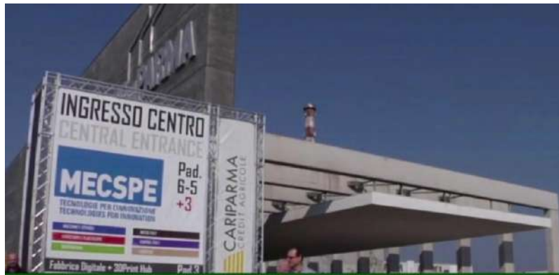
Mec Spe al via domani con 2mila espositori

ia S.p.A. -1,25% 9,48 Hera S.p.A. +0,89% 2,6090 UnipolSai Assicurazioni S.p.A. +1,04% 2,3320 Unipol Grup